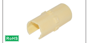
视角标准: 第一视角