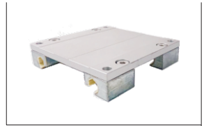
视角标准: 第一视角