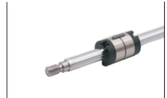
外螺纹退刀槽尺寸表