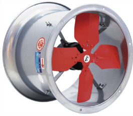
TA系列圆筒形工业换气扇