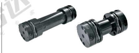
螺钉夹紧分离嵌入式 DFF21