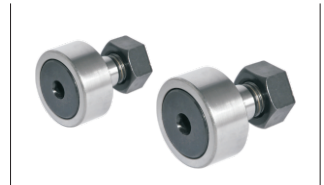
标准型·全滚针圆柱型 BPF07/08